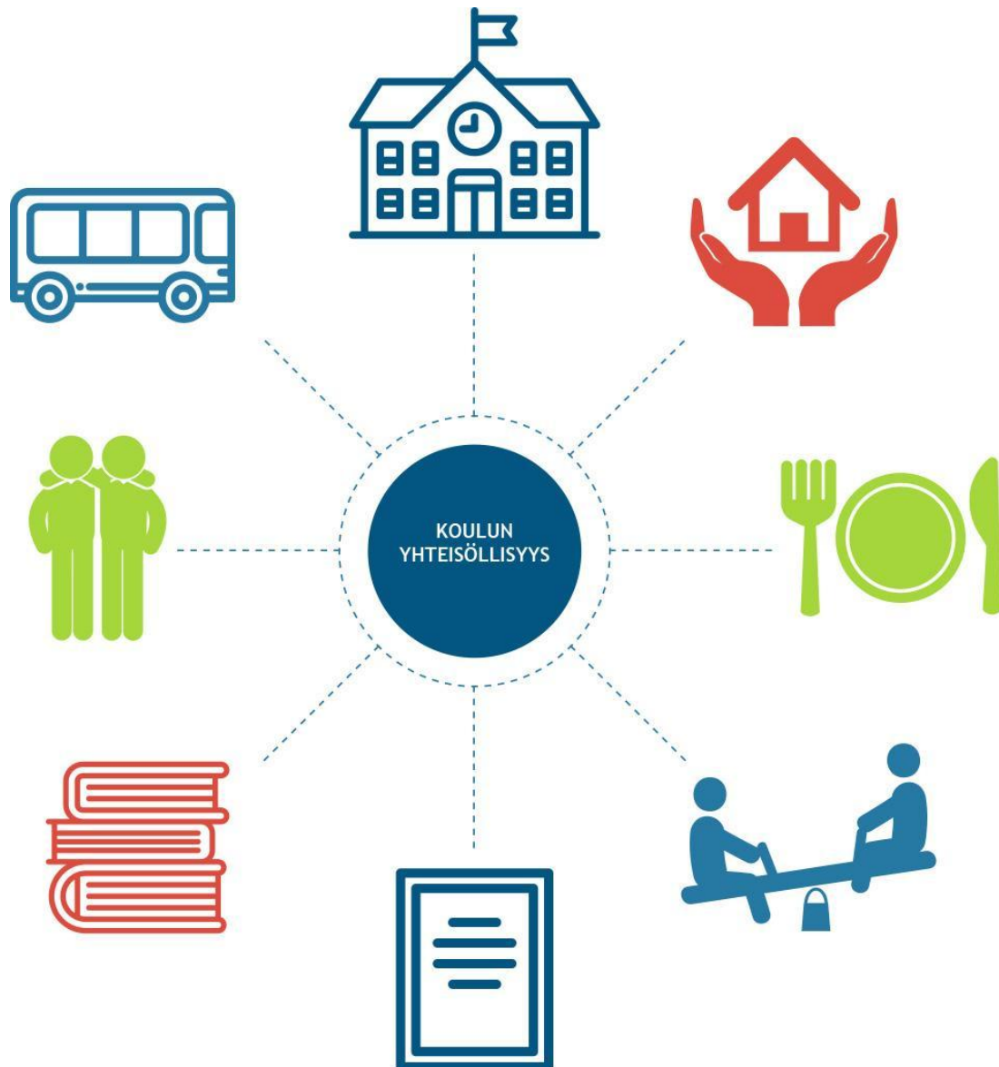
KUVIO Koulun yhteisöllisyys